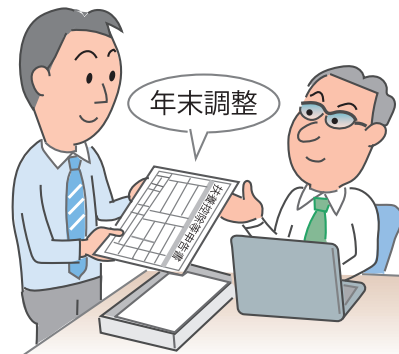
図 年末調整の流れ

具体的には、生命保険料控除欄の「保険金等の受取人」欄のうちの「あなたとの続柄」欄、地震保険料控除欄のうちの「保険等の対象となった家屋等に居住又は家財を利用している者等の氏名」に係る「あなたとの